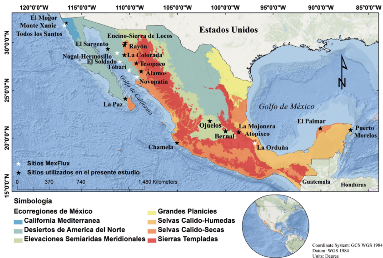
Figura 1. Localización de los sitios de monitoreo de flujos de CO 2 y energía que forman parte del consorcio MexFlux (estrellas), las estrellas negras indican los sitios que aportaron datos para las bases de datos descritas y las estrellas blancas indican otros sitios activos o desmontados en proceso de incorporar datos a MexFlux.

de medición en diferentes ecosistemas de México que usan el sistema de covarianza de vórtices para medir el intercambio de CO 2 y energía entre la biósfera y la atmósfera (Figura 1). Este consorcio tiene entre sus principales objetivos, conocer cuánto CO 2 asimilan o emiten los diferentes ecosistemas de México, así como entender los mecanismos ambientales y bióticos que controlan las tasas de captura y emisión de C (Vargas et al. , 2013). En este artículo se describen las bases de datos sobre flujos de C en ecosistemas terrestres y costeros de México con información proporcionada por los investigadores principales de cada sitio de monitoreo, que a su vez son miembros del consorcio MexFlux.